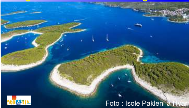
Foto : Isole Pakleni a Hvar